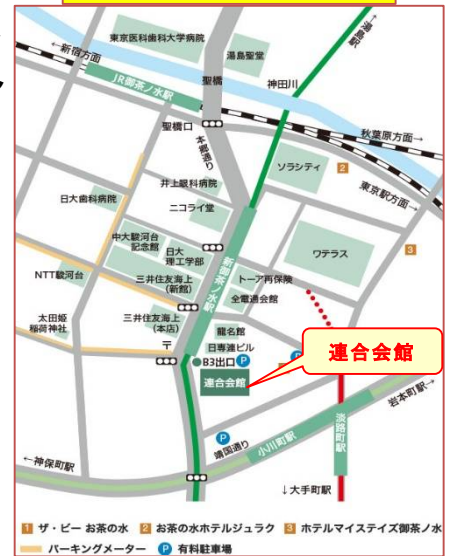
連合会館までの地図

2018年7月11日(水) 17:00～ 参加料：4000円(税込) (1名様)